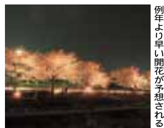
例年より早い開花が予想される