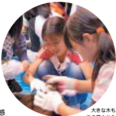
大きな木も一つの苗木から

利用者の視点から施設の在り方を見直す「カルチャーパーク再編整備構想」、秦野盆地の中心を流れる川を生かし新たな都市環境を創る「水無川」風の道「構想」、本市を象徴する緑を保全・創造する「はだの一世紀の森林づくり構想」。こ