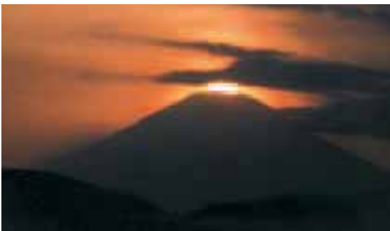
自然が織り成す壮大なショー